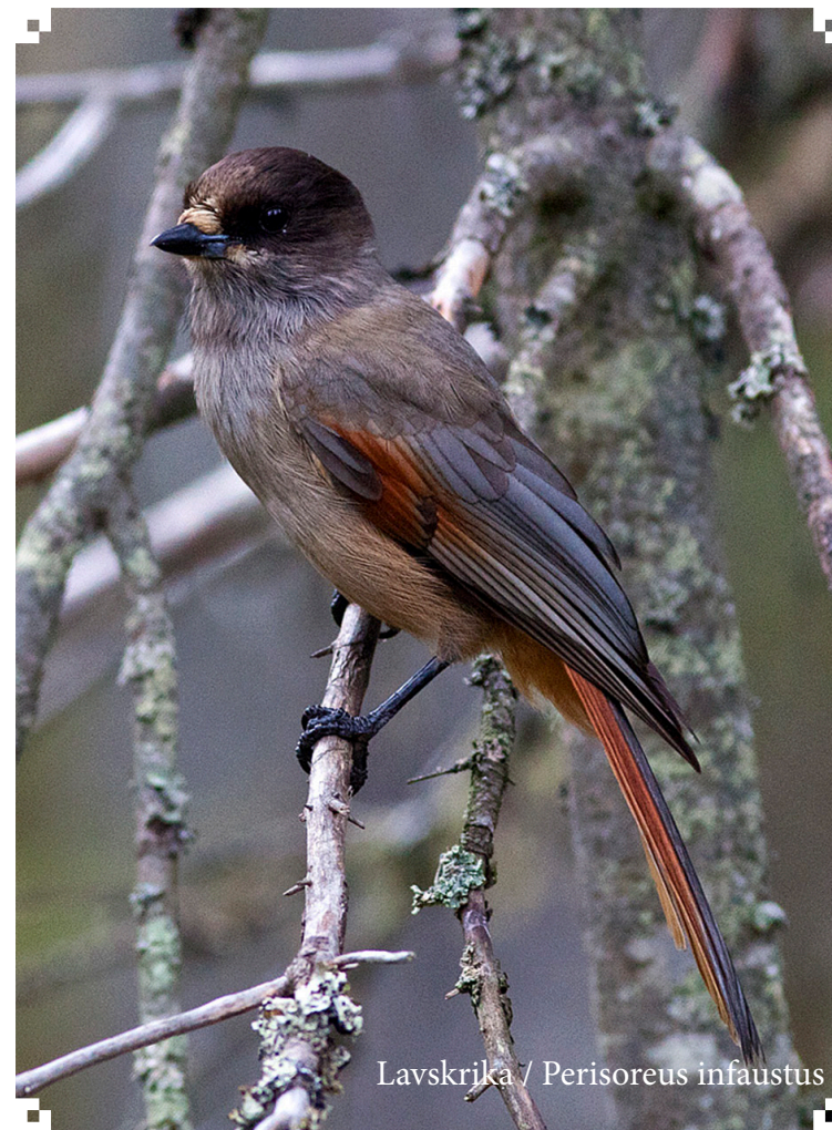
Lavskrika / Perisoreus infaustus